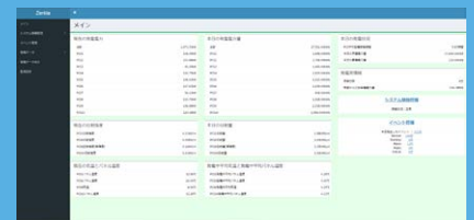
特高設備監視画面